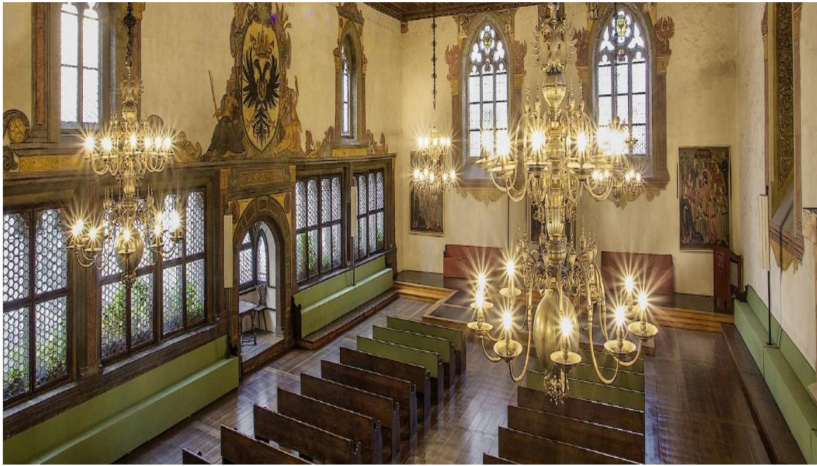
Historischer Reichs·saal